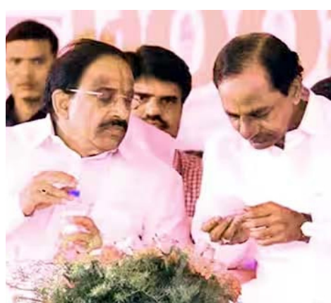
తాను పాలేరులో పోటీ చేసేందుకు అంగీకరించానని గుర్తు చేశారు. ఈ విషయాల మర్చిపోయి కేసీఆర్ ఇప్పుడు దిగజారుడు వ్యాఖ్యలు చేస్తున్నారని, ఇది చాలా దురదృష్టకరం అని అన్నారు.

తన ఓటమికి కారణం కేసీఆర్ కు తెలుసు.. 2018లో జరిగిన ఎన్నికల్లో పాలేరులో తాను ఓడిపోయానని, కానీ దానికి కారణం ఎవరో సీఎం కేసీఆర్ అంతరాత్మకు తెలుసని తుమ్మల అన్నారు. పువ్వాడ అజయ్యకు మంత్రి పదవి ఇచ్చేందుకు కేసీఆర్ తన ప్రత్యర్థికి డబ్బులు ఇచ్చారని, తనను ఓడించారని ఆరోపించారు. పాలేరుకు వచ్చిన ఉప ఎన్నికల్లో పోటీ చేసేందుకు పార్టీ నుంచి ఎవరూ ముందుకు రాలేదని తుమ్మల అన్నారు. అయితే పార్టీ శ్రేయస్సు కోసమే