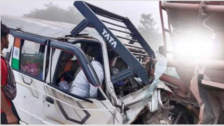
చిక్కుకొన్నా: కర్ణాటకలోని చిక్కుకొన్నాలో గురువారం జరిగిన ఘోర రోడ్డు ప్రమాదంలో 13 మంది దుర్మరణం చెందారు. విగత జీవులందరూ శ్రీ సత్య సాయి జిల్లా గోరంట్ల మండలంలోని సమీప గ్రామాలకు చెందిన వలస కూలీలుగా గుర్తించారు. దసరా పండుగకు సొంతాళ్లకు వచ్చి.. తిరిగి బెంగళూరు బయలుదేరిన వీరిని మృత్యువు కాటేసింది. మృతుల్లో ముగ్గురు మహిళలు, ఒక బాలుడు ఉన్నారు. కాగ వీరిలో సాప్లవేర్ ఉద్యోగులూ ఉన్నారుని పోలీసులు చెబుతున్నారు.